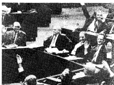
Afstemning i Knesset (ældre billede)

I lovens anden del tales der tilsvarende om, at den, der modtager penge eller et andet