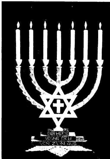
For de messianske jøder smelter korset sammen med de jødiske symboler. Som Kristustroende følger de sig netop som jøder

behandlet om dette spørgsmål, har indtil nu gået de messianske jøder imod. Højesteret har erklæret, at en døbt jøde ikke længere er jøde . - Og en del arabiske kristne i nabolaget har vanskeligheder med at forstå, at de kristne jøder skal tale så stærkt, som de