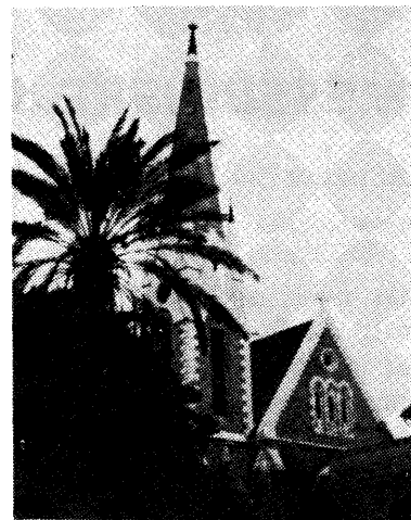
Immanuelskirken i Tel Aviv er hjemsted for en luthersk menighed af messianske jøder. Arbejdet her ledes af den norske Israelmisjon.

Den kristne jødes situation i dag i Israel minder desuden for en stor del om de første kristnes situation. De trænger til forståelse, opbakning og forbøn fra vor side. Vi for vor del beriges ved at beskæftige os med dem, også selv om man ikke direkte er involveret i mission til jøder.