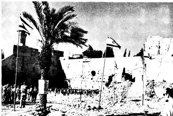
Sådan så det ud, da jøderne i 1967 kunne komme frem til Grædemuren for at bede.

tage. Som anbefalede emner er f. eks. givet: »Jerusalem, den hellige by«, »Jerusalem, fredens by« og »Jeg er i Jerusalem«. Som sponsor for denne første internationale børnetegningskonkurrence om Jerusalem står 9 israelske organisationer, deriblandt flyveselskabet El-Al, hvis kontorer i udlandet formidler information om konkurrencen.