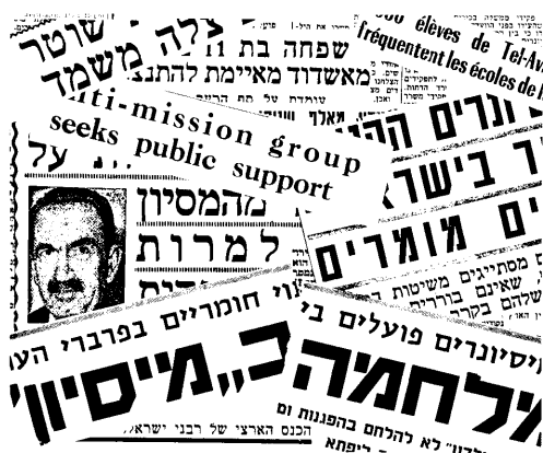
Avisoverskrifter fra den anti-missionskampagne, der førte til lukning af skoler.

Kristen mission har alle steder været en kombination af