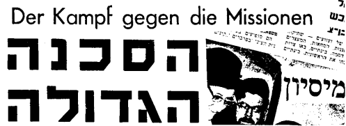
Der Kampf gegen die Missionen