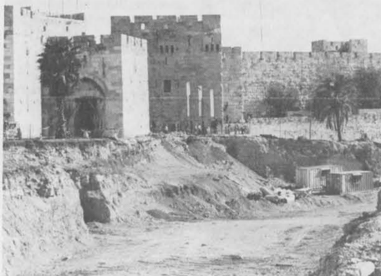
I 1898 blev voldgraven foran Jaffa-porten fyldt op. I efteråret 1989 kom resterne heraf til syne igen, da man gravede i forbindelse med anlægning af ny vej. Desuden fandt man rester fra byzantisk tid.

Længere mod nord lå den lille Herodes-port og i den østlige del af muren lå Løve-porten, el-