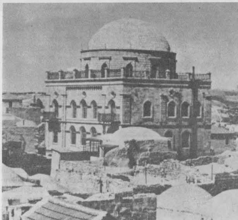
Tiferet Israel synagogen, sådan som den så ud før 1948.

De ashkenaziske jøder har i begyndelsen ikke mulighed for at bygge deres egen synagoge, men holdt deres gudstjenester i Beth El synagogen og i den omtalte yeshiva. Under det egyptiske styre – måske et par år før – fik de ejendomsret over det grundstykke, hvor en tidligere stor synagoge havde ligget, og som kaldtes Hurva (Ruin). I 1836 begyndte man at rydde op og byggede Menahem Sion synagogen, som blev indviet året efter. Alle var ikke tilfredse med, at synagogen skulle ligge her, men ville hellere bruge stedet til beboelseshuse. De utilfredse blandt de ashkenaziske jøder byggede derefter deres egen synagoge, som kaldtes Sukkat Shalom.