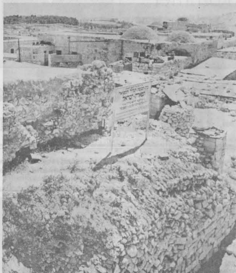
Tiferet Israel synagogen – eller resterne af den – i juni 1967.

efter at han var indvandret fra Babylon.