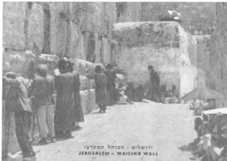
ירושלים - הכותל המערבי JERUSALEM - WAILING WALL

Fra begyndelsen af 1880'erne og til 1913 tændte jøder olielamper ved muren fredag aften. Den tyrkiske regering forbød denne skik i 1913. Ved