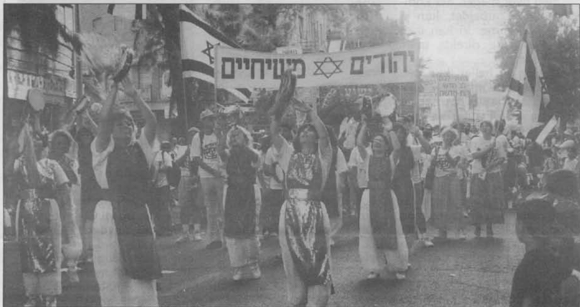
Fortroppen af gruppen med messianske jøder ved Jerusalem-marchen.

Igen i år deltog en gruppe messianske jøder i den såkaldte Jerusalem-march, som afholdtes i forbindelse med fejringen af løvhyttefesten. Hundredevis af større og mindre grupper deltog, fra udland og indland. Festligt ser det ud, når grupper med forskellige kendetegn marcherer gennem Jerusalems gader.