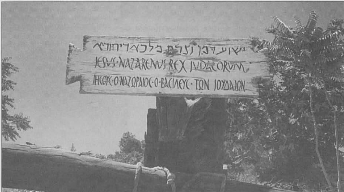
»Jesus jødernes konge«. Rekonstruktion af Jesu kors – fra den bibelske have mellem Betlehem og Jerusalem

• Overvej det forhold, at der ikke skal stilles et konkurrenceforhold op mellem hvor meget og hvor længe andre korsfæstede har lidt i forhold til Jesus. Det afgørende er, hvilken betydning Jesu lidelse og død har for andre.