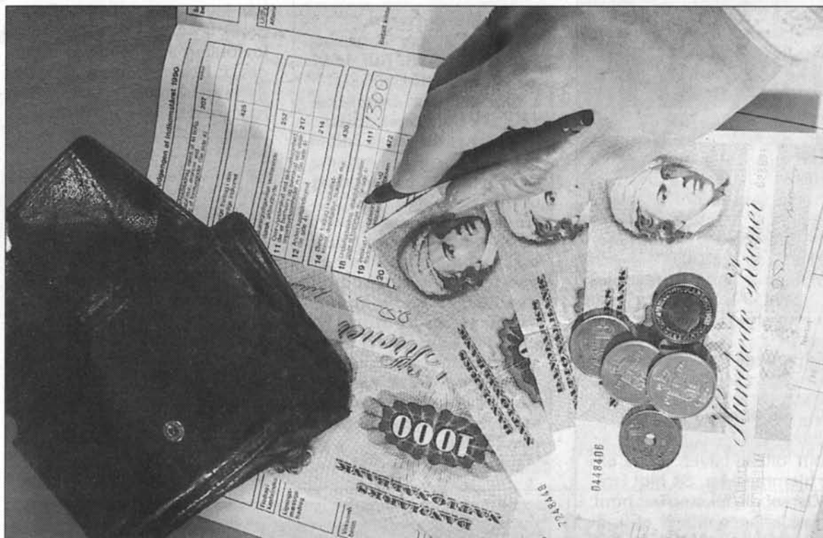
Små og store penge kan blive til et anseligt beløb hvis der bare er tilstrækkelig mange der vil hjælpe til.