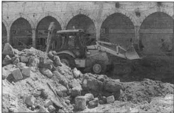
I Betlehem arbejder man på at gøre byen til den mellemøstlige turistattraktion nr. 1.