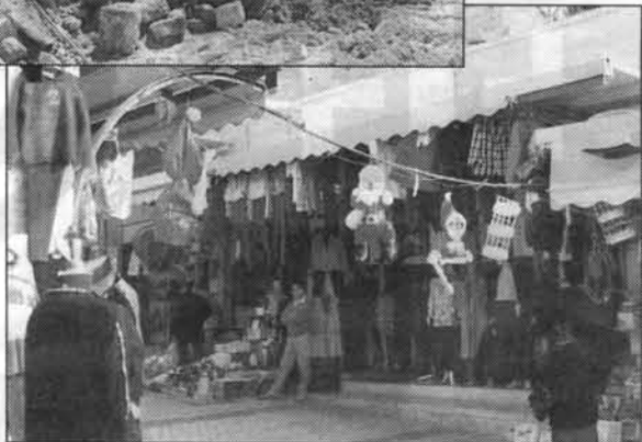
I Nazaret gik muslimer i december 1998 til angreb på butikker med julepynt.