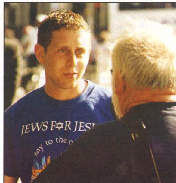
Israelsmissionens Avis nr. 3, 2005

Ved henvendelse til sekretariatet sender vi gerne et eksemplar af dette engelske dokument som gave. Vi vedlægger et girokort – og så kan man selv bestemme, hvis man vil sende os en gave. For eksempel på 50 kroner.