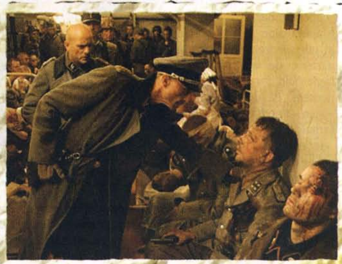
Der Untergang (www.deruntergang.dk)

kum gå så stille ud af en biograf. Jeg så filmen sent påskedagsaften. Efter at have fejret Kristi opstandelse. Det nærmer sig det blasfemiske at sammenligne Hitler og Jesus. Men hvilken forskel på Hitlers despotiske magt og Jesu selvhengivende tjeneste for folkets skyld – en tjeneste der førte til død for Jesus og liv for folket.