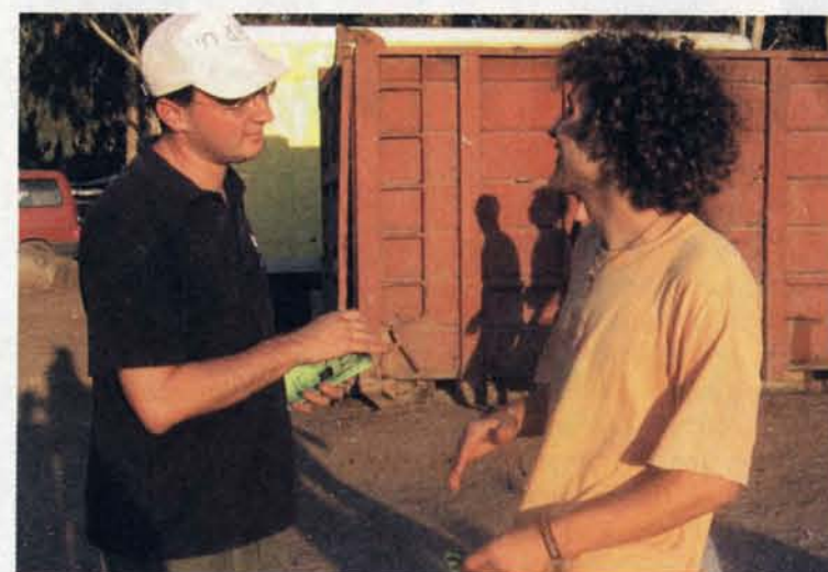
At dele evangeliet med jøder betragter Israelsmissionen ikke som et udtryk for "antijødisk retorik og teologi".

Med udgangspunkt i denne notits vil jeg tage to forhold op. For det første nogle ord om bønner for Israels frelse, Israel her forstået som folket Israel . Og for det andet vil jeg sige noget om, hvordan man i det 19. århundrede reagerede på manglende succes i arbejdet for jødernes frelse.