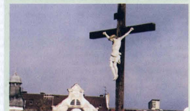
Paulus: "Vi prædiker Kristus som korsfæstet, en forargelse for jøder og en dårskab for hedninger" (1 Kor 1, 23).

Gud har forpligtet os til at forkynde ordet, så troen kan skabes. Selv er han ikke bundet af dette forhold. Hvad Gud ellers måtte gøre for at få mennesker i tale, er hans sag. Paulus kom ikke til tro ved, at nogen forkyndte ordet for ham. Han mødte Jesus, eller rettere: Jesus mødte ham i en direkte åbenbaring på vej til Damaskus. Lukas lader Paulus fortælle om sin omvendelse og sit kald tre gange i Apostlenes Gerninger. Men for Paulus er måden, han kom til tro på, ikke normativ for andre. Han siger ikke: Vent på direkte åbenbaringer eller visioner. Han siger: forkynd! For troen kommer af det, som høres. Og hører man til dem, der i dag får direkte åbenbaringer fra Gud, er man forpligtet på at henvise andre til det åbenbarede ord i Skrifterne.