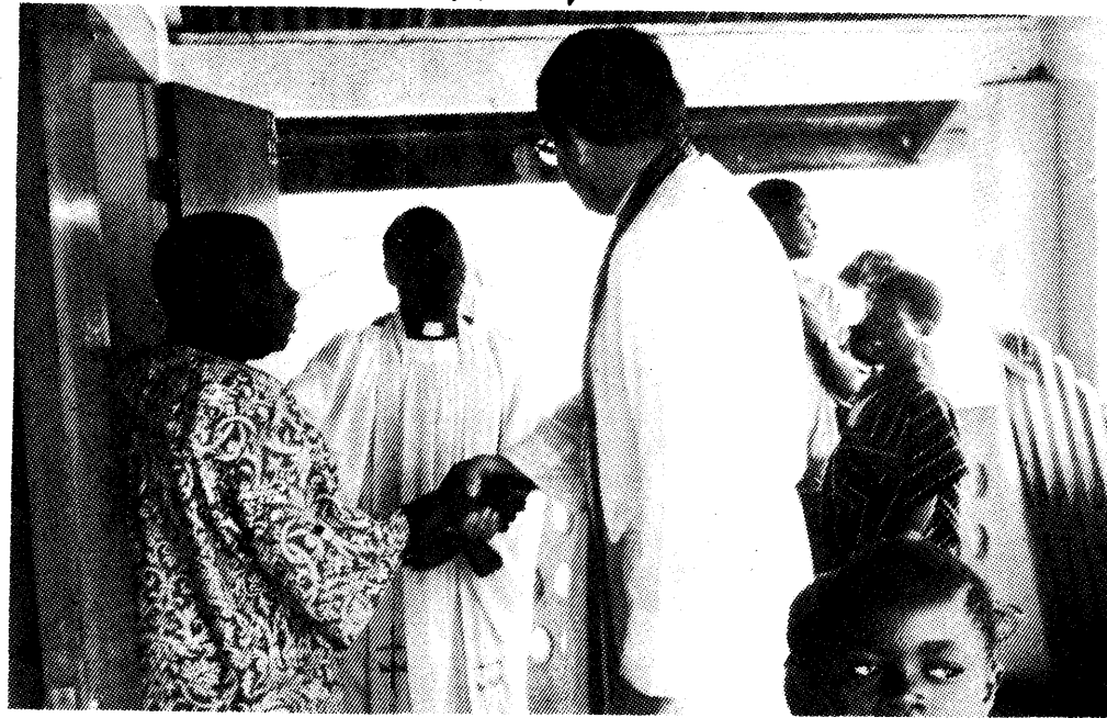
Skal man have en hvid præst, som man ikke skal betale løn til, eller en sort, som må have en farm, fordi menighederne ikke kan give ham en ordentlig løn?