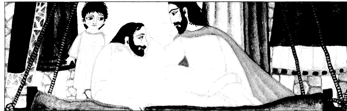
»Rejs dig, tag din seng og gå hjem« siger Jesus til den lamme. Situationen er her illustreret af Esben Hanefelt Kristensen.