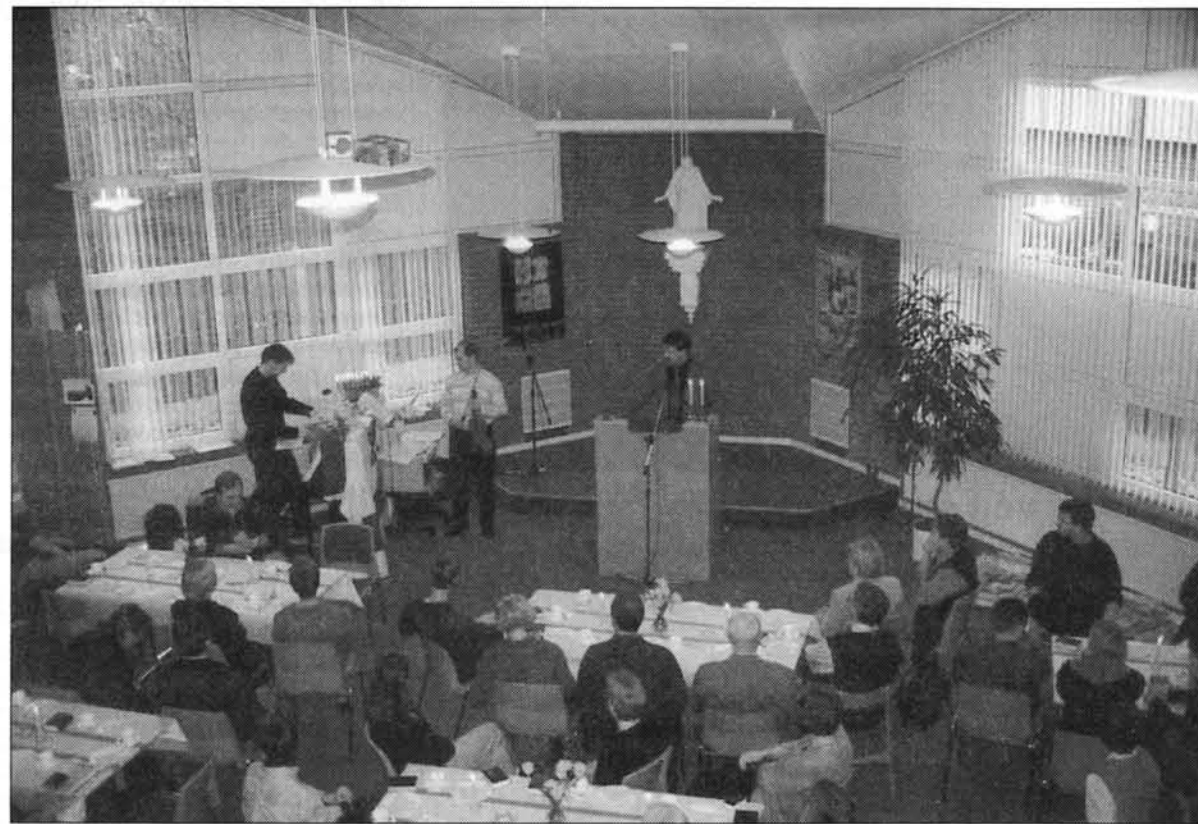
Årsmødet set lidt fra oven i det nye funktionelle missionshus i Skjern.