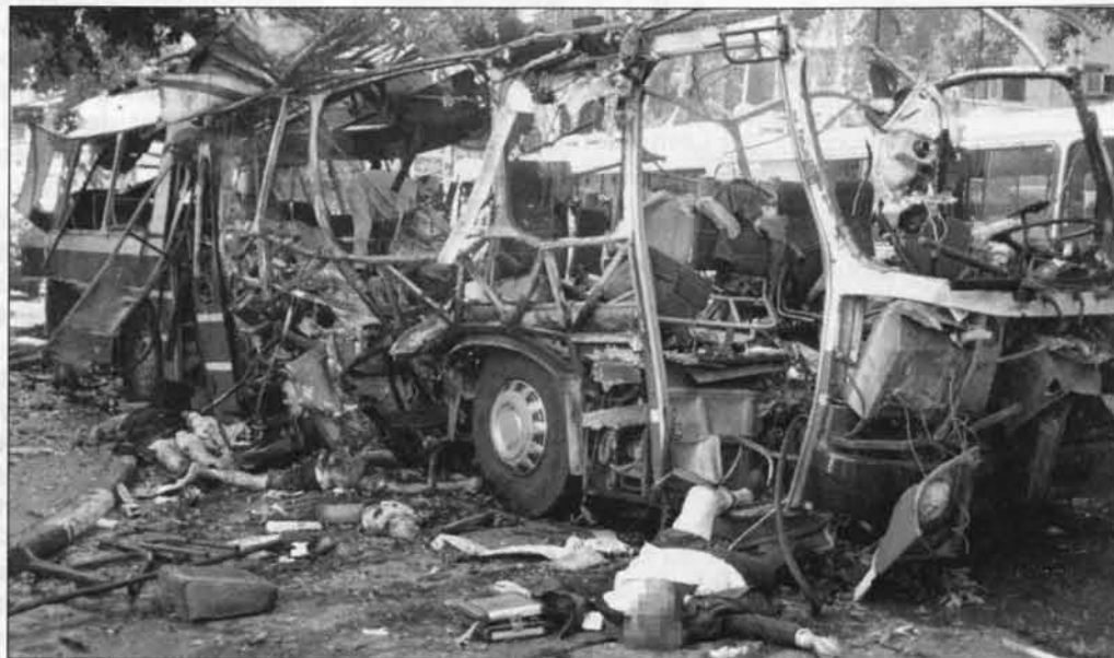
Israelsk bus efter at en palæstinensisk terrorist har udført sin ugerning.

I alt væsentligt er jeg enig med Pundik, når det gælder indrømmelser og dannelsen af en palæstinensisk stat. Nogen vil givetvis kalde denne løsning for naiv. At den bliver svær at implementere, behøver man ikke at være profet for at se. Uden virkelige indrømmelser fra begge sider ingen bedring. I alle lejre – blandt muslimer, jøder og kristne – er der ekstremister, der ikke vil acceptere sådanne indrømmelser. Vinder de frem, bliver håbet om en va-