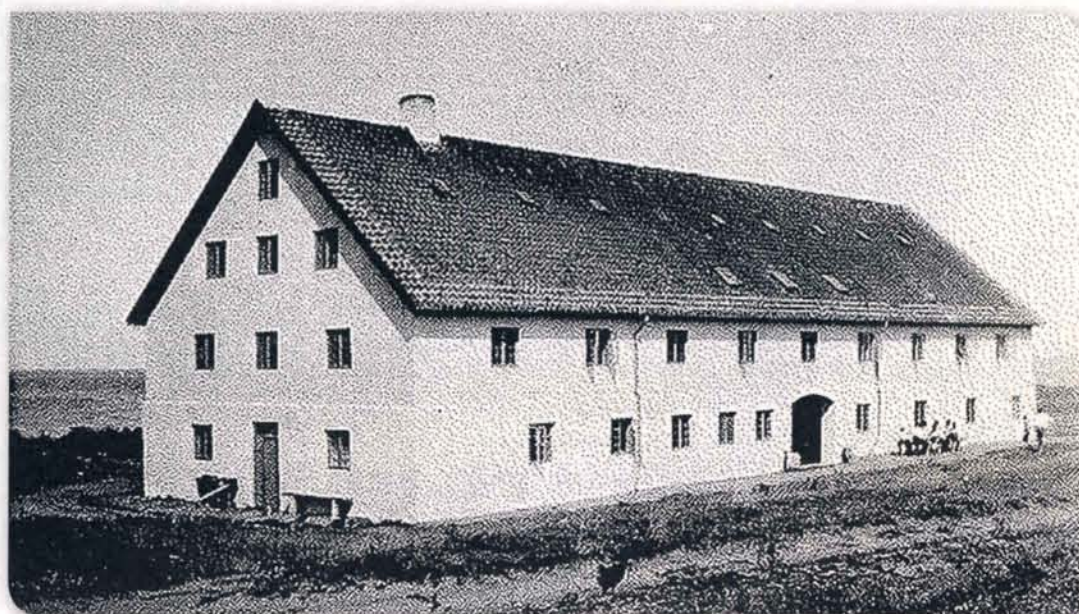
Kornmagasinet i Havnsø, som Israelsmissionen i 1927 gav navnet »Glænø«. I oktober 1943 blev det en »Noahs Ark« for omkring 30 jødiske børn og voksne, som var gemt her, inden de kunne komme videre til Sverige.