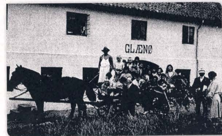
I programmet for Israelsmissionens sommerlejre på »Glænø« ved Havnsø var som regel indlagt en udflugt; her i hestevogn 1931.