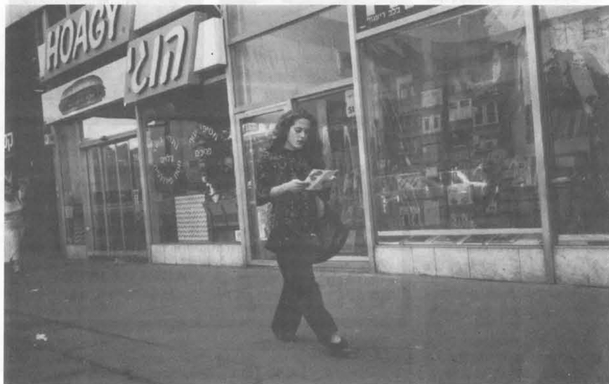
Når man deler traktater ud, er der altid en spildprocent. En del krølles sammen. Her en person i Jerusalem, der kigger i en netop uddelt traktat.