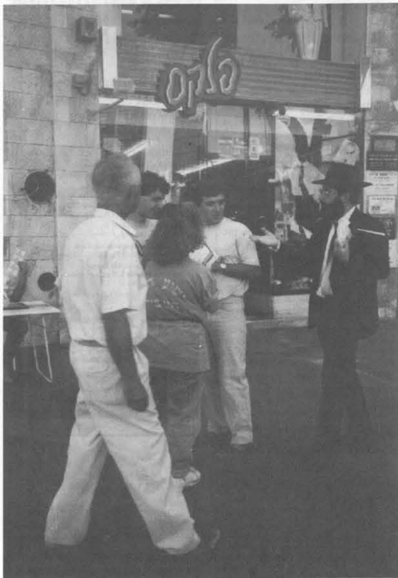
Jøder for Jesus uddeler traktater i Jerusalem. En ortodoks jøde synes at give sin mening til kende.

Lad disse vildledte Jøder for Jesus lære af de jøder, som et kort øjeblik var velvilligt indstillet over for Jesus i hans levetid. De troede også, at han var den længe ventede Messias, men da Jesus begyndte at lære sådanne hedenske idéer som kannibalisme, vendte de sig fra ham i væmmelse (Joh 6,66). Da Jesus ikke oprettede en messiansk tidsalder i sin egen leve-