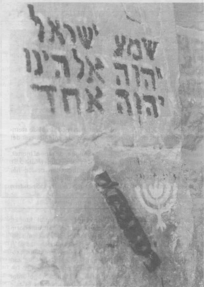
Graffiti med Shema Israel ved Zion-porten i Jerusalem. Til venstre for den syvarmede lysestage er en Mezuzah, hvori der er lagt forskellige skriftord.

Shema Israel kaldes Israels »trosbekendelse« efter de to indledende ord (»Hør, Israell!«). Trosbekendelsen lægges sammen med et par andre skriftord i de to kapsler på de to bede-