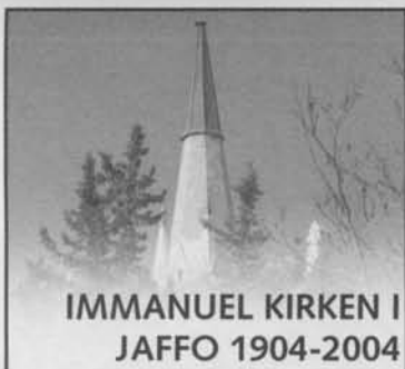
IMMANUEL KIRKEN I JAFFO 1904-2004