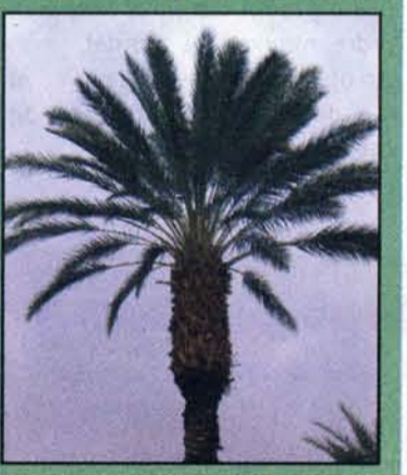
Den retfærdige skyder op som palmen ... (Salme 92,13).

Frøet har ligget opbevaret omkring 30, år før man gik i gang med eksperimentet om at få det til at spire. Hvis planten er hunkønnet, og hvis det fortsætter sin vækst, formodes det, at det vil bære sine første frugter omkring år 2010.