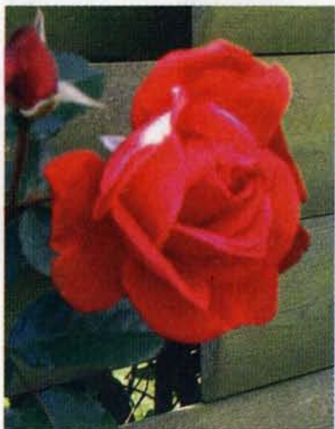
Den yndigste rose er fundet, / blandt stiveste torne oprundet, / vor Jesus, den dejligste pøde, / blandt syndige mennesker gro'de.

konference om jødemission i Ungarn, trak en af talerne denne jødiske fortælling frem: